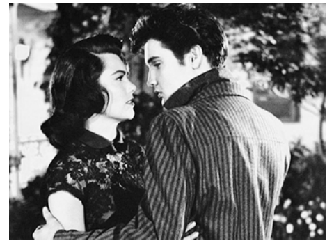
1957 LE ROCK DU BAGNE (Jailhouse Rock) de Richard Thorpe avec Judy Tyler