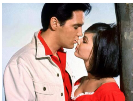
1964 SALUT LES COUSINS (Kissin' Cousins) de Gene Nelson avec Yvonne Craig