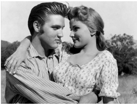
1956 LE CAVALIER DU CRÉPUSCULE (Love me tender) de Robert D. Webb avec Debra Paget