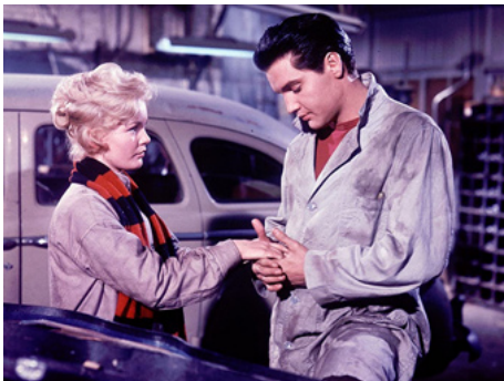
1961 AMOUR SAUVAGE (Wild in the Country) de Philip Dunne avec Tuesday Weld