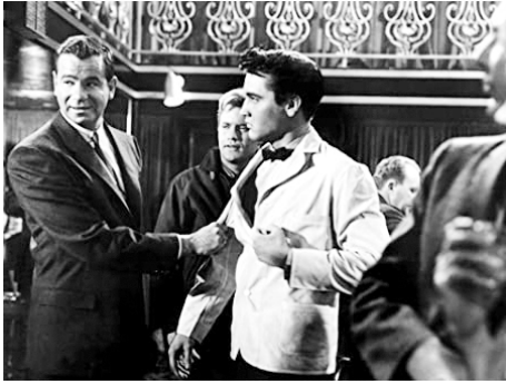
1958 BAGARRES AU KING CREOLE (King Creole) de Michael Curtiz avec Walter Matthau, Vic Morrow