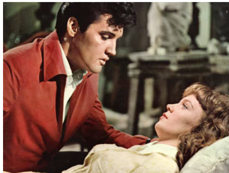
1967 CROISIÈRE SURPRISE (Double Trouble) de Norman Taurog avec Annette Day