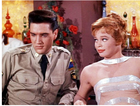
1959 CAFÉ EUROPA EN UNIFORMES (G.I. Blues) de Norman Taurog avec Juliet Prowse