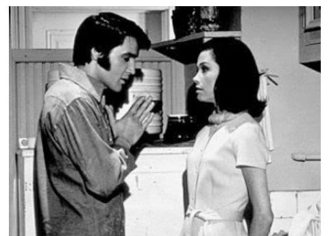
1969 LES ANGES DU FAUBOURG (Change of Habit) de William A. Graham avec Mary Tyler Moore