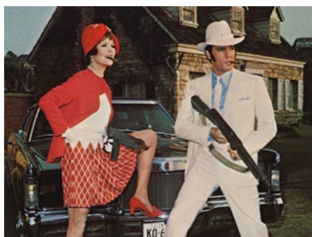
1969 FILLES ET SHOW-BUSINESS (The Trouble with Girls) de Peter Tewksbury avec Sheree North