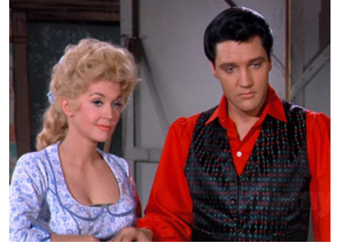
1966 UNE ROUSSE QUI PORTE BONHEUR (Frankie and Johnny) de F. De Cordova avec Donna Douglas