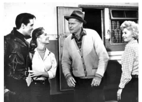
1964 L'HOMME À TOUT FAIRE (Roustabout) de John Rich avec Joan Freeman, Leif Erickson, B. Stanwyck