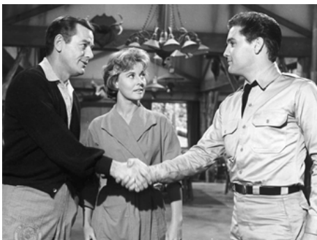
1962 UN DIRECT AU CŒUR (Kid Galahad) de Phil Karlson avec Gig Young, Lola Albright