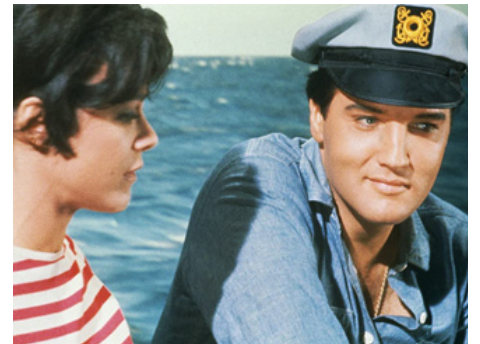
1967 TROIS GARS, UNE FILLE ET UN TRÉSOR (Easy come, easy go) de John Rich avec Dodie Marshall