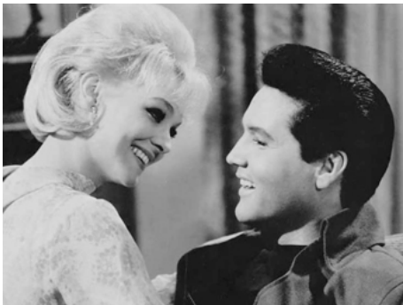
1966 LE TOMBEUR DE CES DEMOISELLES (Spinout) de Norman Taurog avec Diane McBain