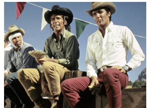
1968 MIC-MAC AU MONTANA (Stay away, Joe) de Peter Tewksbury avec L. Q. Jones