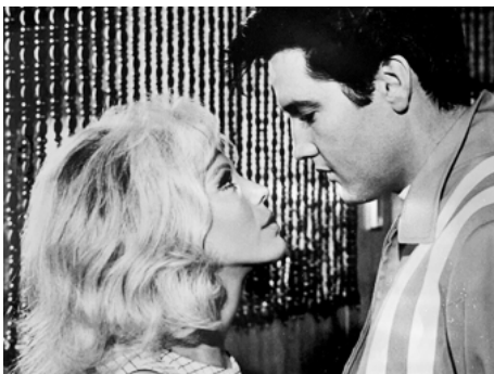
1968 À PLEIN TUBE (Speedway) de Norman Taurog avec Nancy Sinatra