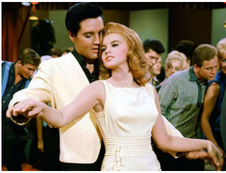
1964 L'AMOUR EN QUATRIÈME VITESSE (Viva Las Vegas) de George Sidney avec Ann-Margret