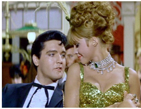
1965 CHATOUILLE-MOI (Tickle me) de Norman Taurog avec Jocelyne Lane