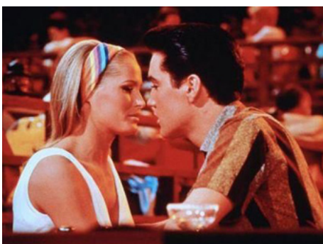
1963 L'IDOLE D'ACAPULCO (Fun in Acapulco) de Richard Thorpe avec Ursula Andress