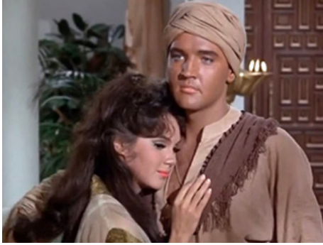
1965 C'EST LA FÊTE AU HAREM (Harum Scarum) de Gene Nelson avec Mary Ann Mobley