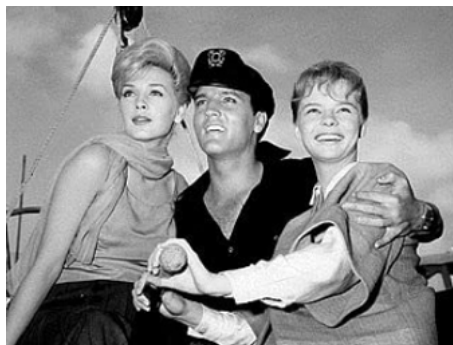
1962 DES FILLES, ENCORE DES FILLES (Girls, girls, girls !) de N. Taurog avec S. Stevens, Laurel Goodwin