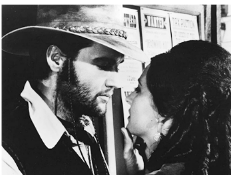
1969 CHARRO (Charro !) de Charles Marquis Warren avec Ina Balin