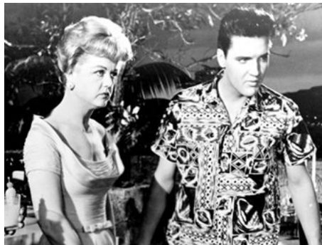
1961 SOUS LE CIEL BLEU D'HAWAII (Blue Hawaii) de Norman Taurog avec Angela Lansbury