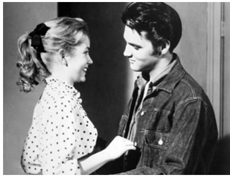
1957 AMOUR FRÉNÉTIQUE (Loving You) d'Hal Kanter avec Dolores Hart